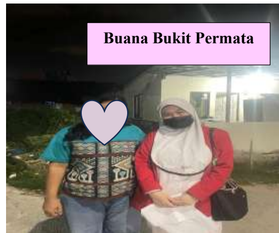
Buana Bukit Permata